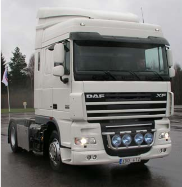
Trux X-light pour DAF XF (K61-1)

De conception élégante, la rampe Trux X-light permet le montage aisé de feux supplémentaires sur le devant de la cabine. Les faisceaux de câbles sont intégrés. Elle a pour fonction supplémentaire de servir de marche pied afin de faciliter le nettoyage du pare-brise.