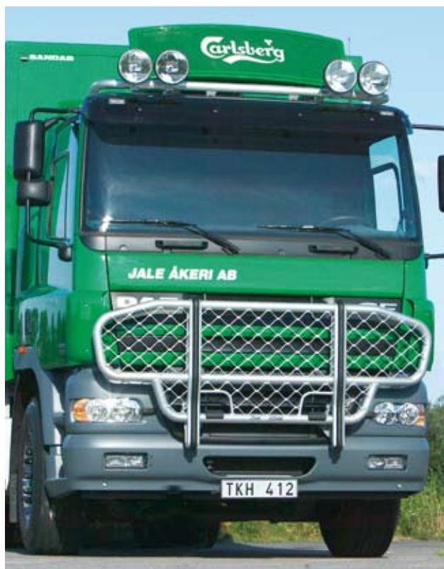
Trux Offroad pour DAF CF (B61-3)

Le pare-buffle Trux Offroad bénéficie d'une haute garde au sol, et convient donc parfaitement aux véhicules de transport du secteur du BTP ou autres, nécessitant de rouler sur un sol irrégulier.