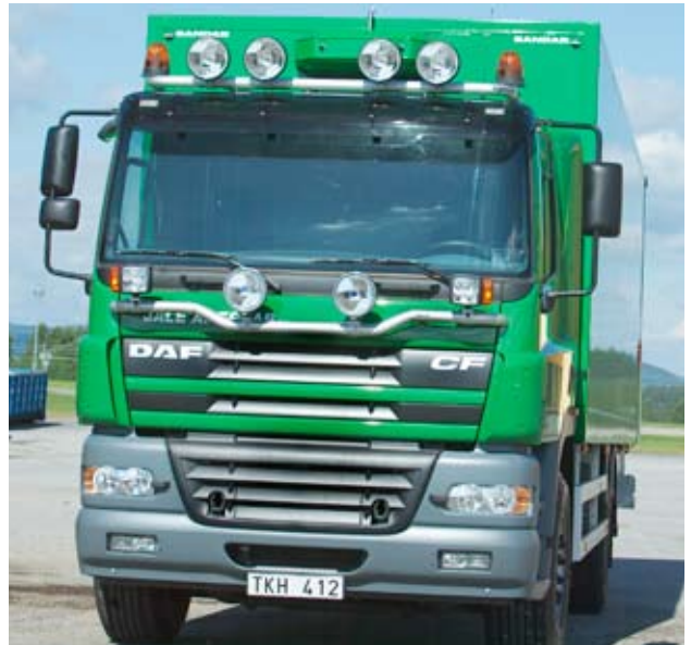
Trux rampe de phares pour DAF CF (H61-3)

La rampe de phares Trux est idéale pour les véhicules équipés de chasse-neige et autres outils montés à l'avant. Sur la rampe de feux haut placée, des feux spéciaux pour chasse-neige peuvent être montés à la place des feux ordinaires. La flexibilité de la rampe de feux Trux permet également de monter des feux supplémentaires.