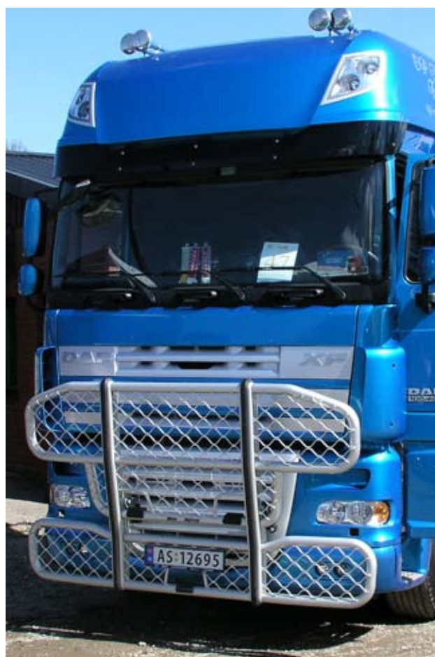
Trux Highway pour DAF XF (A61-1)

Notre modèle le plus vendu que l'on retrouve aujourd'hui sur des milliers de véhicules partout en Europe. Le pare-buffle Trux Highway est conçu pour accroître votre sécurité et protéger les pièces sensibles de votre véhicule. La partie basse du pare-buffle fonctionne également comme protection anti-encastrement tout en donnant beaucoup de caractère à votre véhicule. Trux Highway peut être complété de pré-câblages et phares supplémentaires, selon vos besoins.