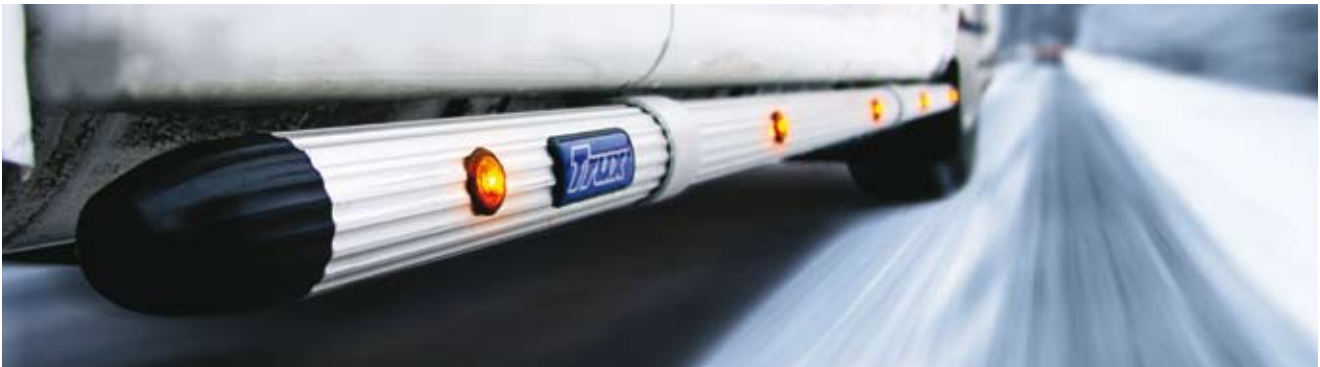
Trux Sideliner pour DAF (S-1 et S-2)

La rampe latérale sideliner Trux est une manière de rehausser vos équipements latéraux sur votre ensemble routier, ici monté avec les feux led orange.