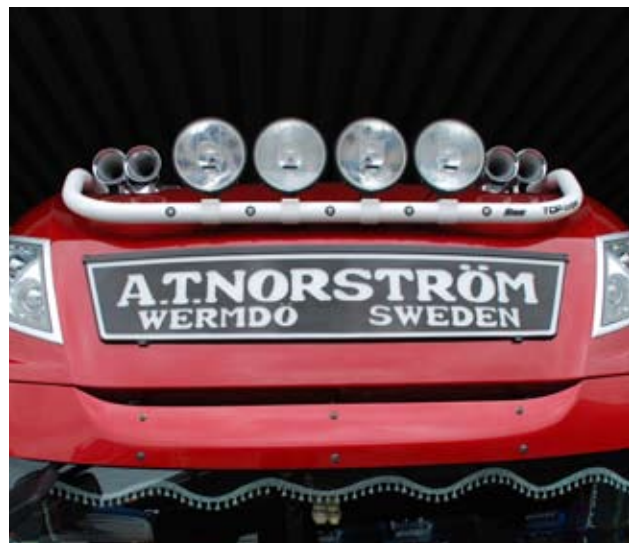
Trux Top-bar pour DAF 105XF Super Space cab (G62-5)

Trux Top-bar vous offre des possibilités quasi illimitées. Achetez les pièces qui vous sont nécessaires aujourd'hui et complétez votre équipement au fur et à mesure de vos besoins.